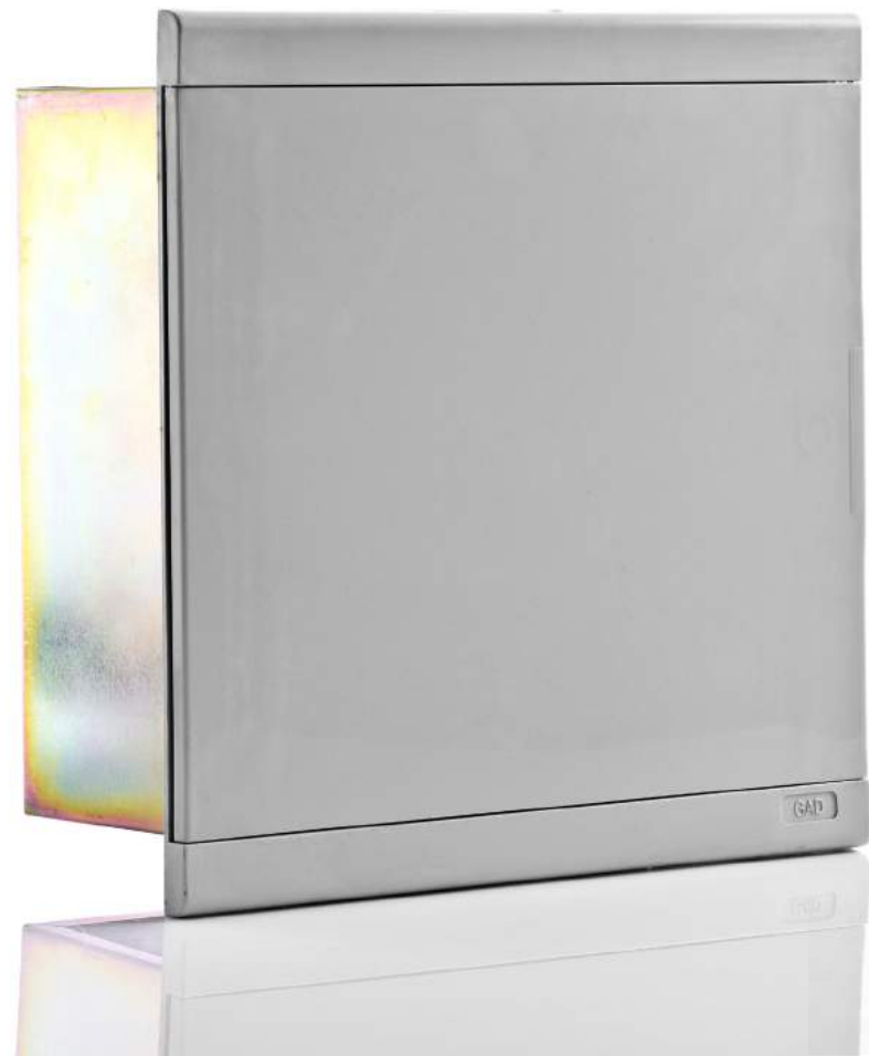
CM 12 OCPS

لوحات داخل الحائط ذات علبة معدنية لزوم عدادات الكهرباء