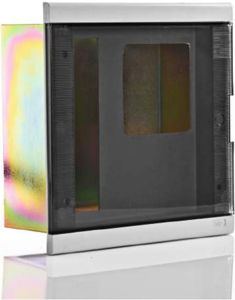
CM 12 CPS

*M= is Electric meters according to Egyptian standards